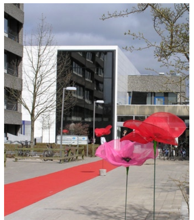
Vollsmose Kulturhus skulle gerne være et levende og åbent hus for områdets beboere. Men en gruppe drenge gør det svært for de ansatte at holde huset så åbent, som man havde håbet. Billederne herover er fra indvielsen af kulturhuset i foråret 2008. Personerne på billederne har intet med den aktuelle sag at gøre.