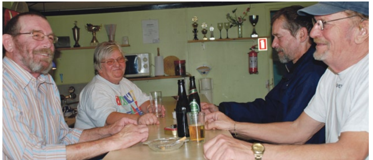
Baren og det ugentlige sildebord er centrale elementer i det sociale samvær i Aktivisten.

Aktivisten fungerer også som et socialt netværk. Det er her, dagligdagens problemer diskuteres, og mange venskaber er startet her. I Aktivisten passer man på hinanden, er en stamgæst