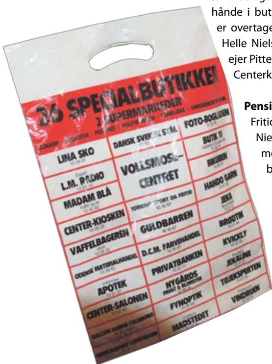
Den gamle indkøbspose fortæller, at der dengang fandtes 26 specialbutikker i centret.

sen konstaterer. Butikken er et overflødigshorn af varer, som man almindeligvis ikke ser i en normal kiosk. Her sælges bl.a. legetøj, bagerbrød og barbergrej. Man kan oven i købet få rensed tøj, og i en tid, hvor rygere er et jagtet folkefærd, kan man hos Hans